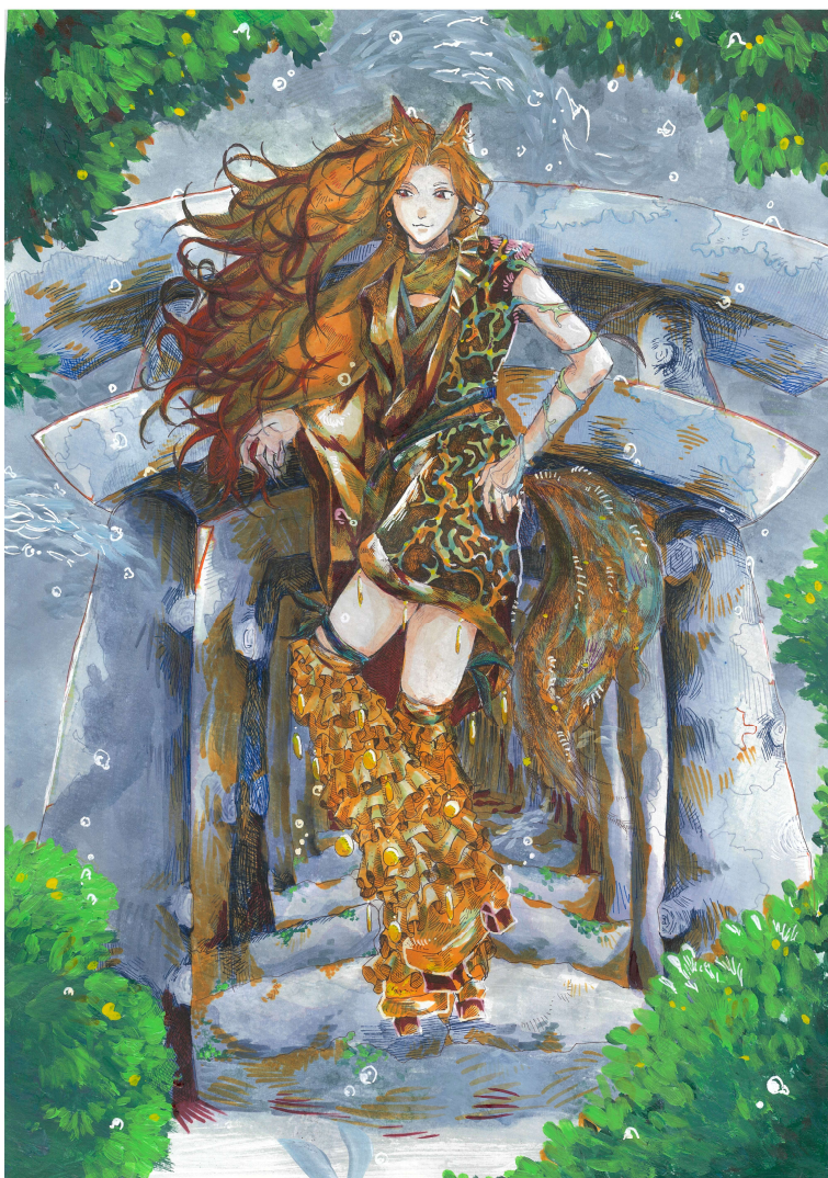
第22回グランプリ受賞作品